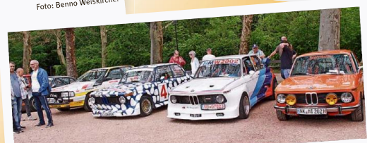
Beim Oldtimer- und Youngtimer-Treffen des Hüttigweiler Eichert-Racing-Teams (ERT) gab es im Illinger Burgpark auch Sportwagen zu bestaunen. Hier bot sich auch für die Autofreaks die Gelegenheit, ausgiebig zu fachsimpeln. 310 Fahrzeuge füllten den gesamten Burgpark.