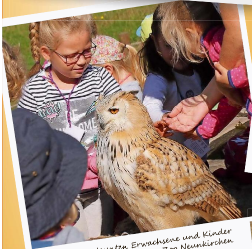
Im September staunten Erwachsene und Kinder beim Besuch der Falknerei im Zoo Neunkirchen gleichermaßen über die Flugkünste diverser Eulen und Greifvögel. Hier bewundern die Kids einen imposanten Uhu.