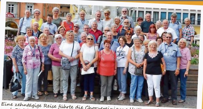
Eine zehntägige Reise führte die Chorvereinigung Heiligenwald im August nach Südtirol. Hier ein Gruppenfoto vor dem Denkmal von Walther von der Vogelweide in Bozen.