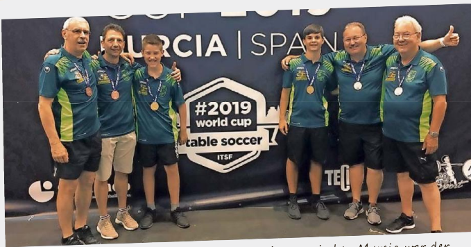
Bei der Tischfußball-Weltmeisterschaft 2019 im spanischen Murcia war der OTC Ottweiler mit sechs Teilnehmern am Start. Für den OTC war es am Ende mit insgesamt neun Medaillen eine überaus erfolgreiche WM.