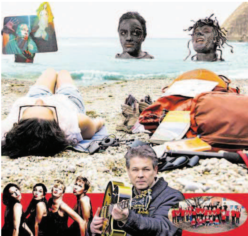
Das Kulturprogramm im big Eppel ist wieder ein bunter Strauß an verschiedenen Highlights.

NEUNKIRCHEN Teilen dieser Ausgabe liegen Prospekte bei von Aldi, Baumarkt Globus, Drogerie Müller, Hammer, SB Möbel Boss, E-Center Wellesweiler, Edeka, Edeka-Sonderhandzettel, EdekaXPRESS Niederkirchen, Globus SB Warenhaus, Netto, Neukauf Journal, Penny Markt, PostenBörse, Reuter, Rewe Markt, Thomas Philipps und Wasgau bei. Aktuelle Beilagen finden Sie auch auf www.WochenpiegelOnline.de/Prospekte .