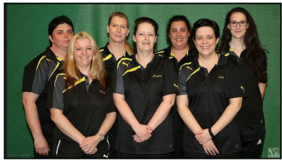
1. Damenbundesliga 2016