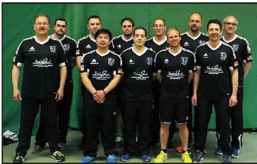
1. Herrenbundesliga 2016