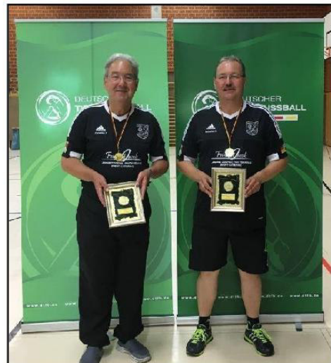
Gewinner Seniorendoppel bei der GMO 2016

und damit Teilnehmer der Heim – WM 2017 in Hamburg